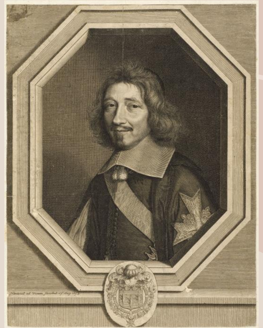
NANTEUIL Robert, Michel Le Tellier , 1658, estampe, H: 32cm x l: 24,60cm, Rennes, Musée des Beaux-Arts (794.1.5156)