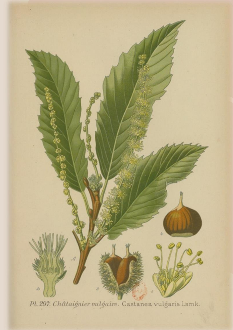
MASCLEF Amédée, Atlas des plantes de France utiles, nuisibles et ornementales , tome 3, Paris, P. Klincksieck, 1891, planche 297.