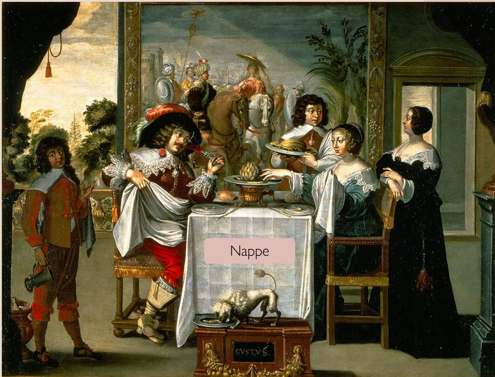
BOSSE Abraham (d'après), Les Cinq Sens 1638, huile sur toile, 134cm x 157cm, Tours, Musée des Beaux-Arts (Inv. 1912-1-3).