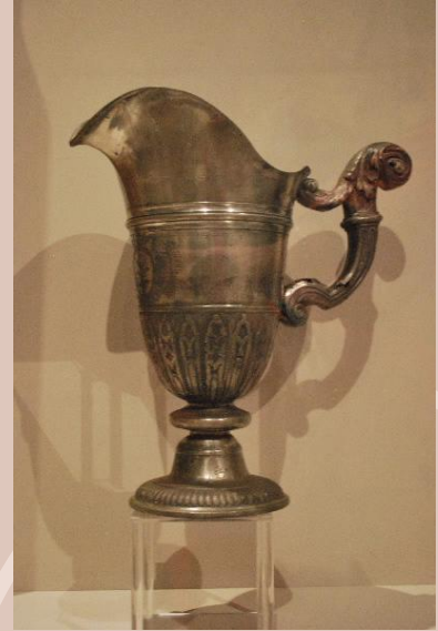
Aiguière casque, XVIIe- XVIIIe siècle, étain, h:29,6cm; l:28,2cm, Autun, Musée Rolin (CH.551)