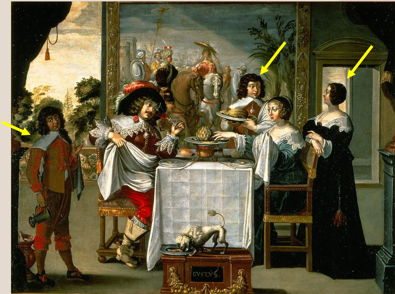
BOSSE Abraham (d'après), Les Cinq Sens 1638, huile sur toile, 134cm x 157cm, Tours, Musée des Beaux-Arts (Inv. 1912-1-3).