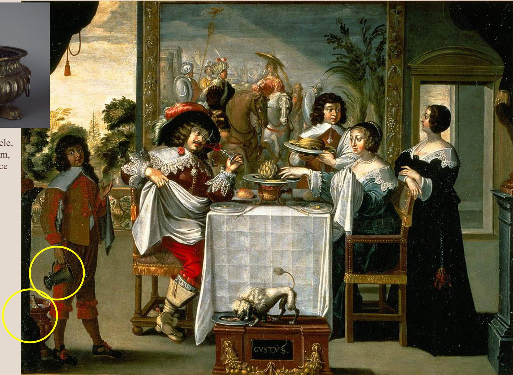
BOSSE Abraham (d'après), Les Cinq Sens 1638, huile sur toile, 134cm x 157cm, Tours, Musée des Beaux-Arts (Inv. 1912-1-3).