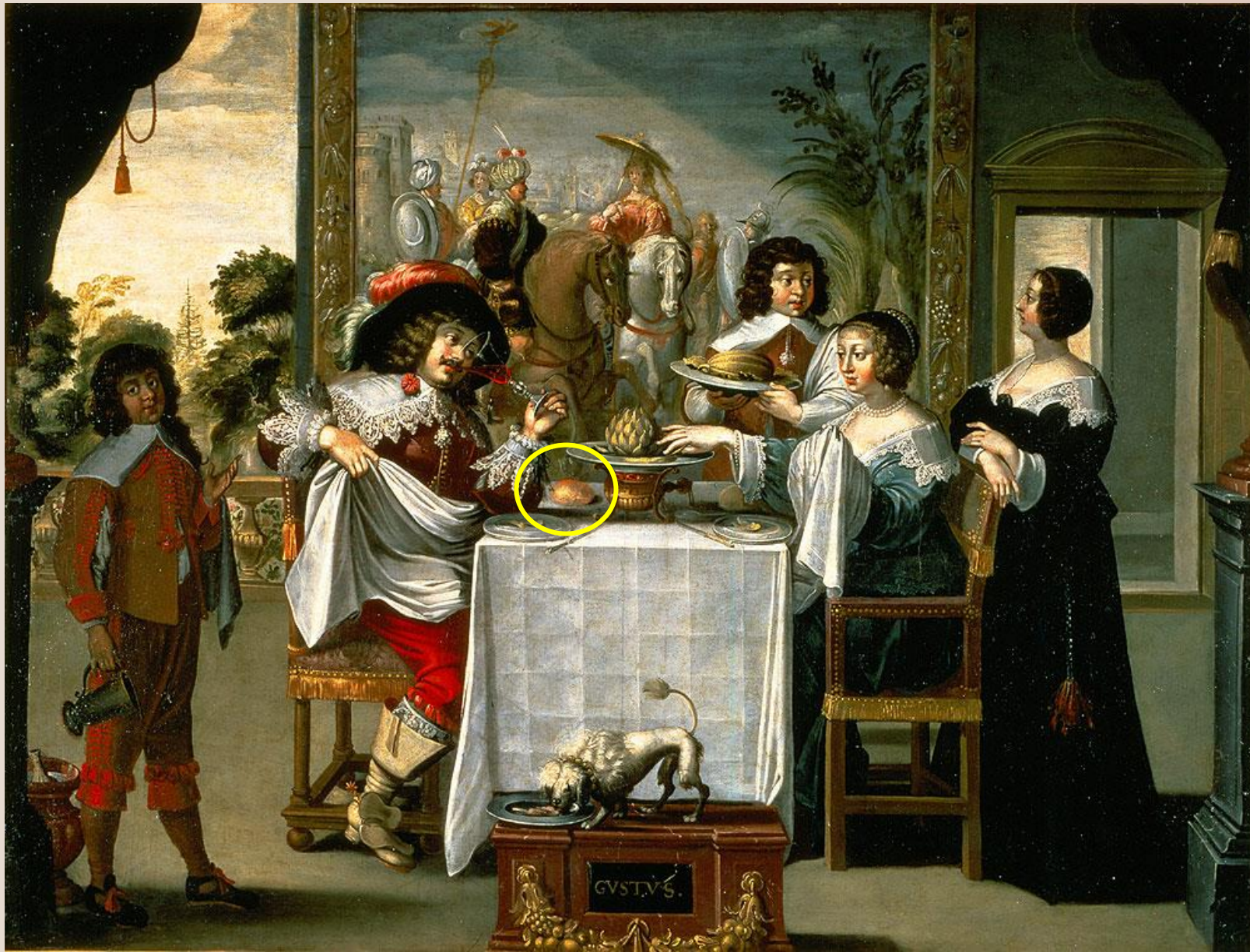
BOSSE Abraham (d'après), Les Cinq Sens 1638, huile sur toile, 134cm x 157cm, Tours, Musée des Beaux-Arts (Inv. 1912-1-3).