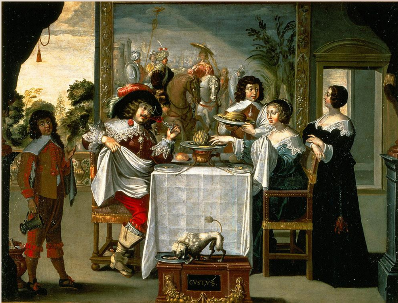
BOSSE Abraham (d'après), Les Cinq Sens 1638, huile sur toile, 134cm x 157cm, Tours, Musée des Beaux-Arts (Inv. 1912-1-3).