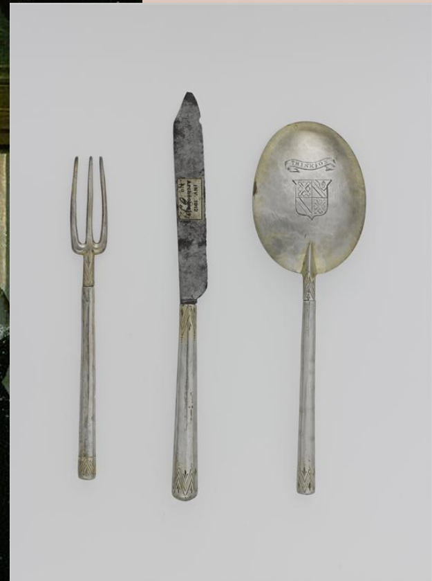
Petite trousse de table, XVIIIe siècle, argent et cuivre, Lille, Palais des Beaux-Arts (A 632)