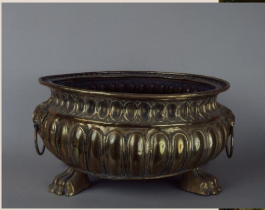
Rafrâchissoir, XVIIIe siècle, cuivre, h:17,5cm ; d:35cm, Lille, musée de l'Hospice comtesse (SPBA 464)