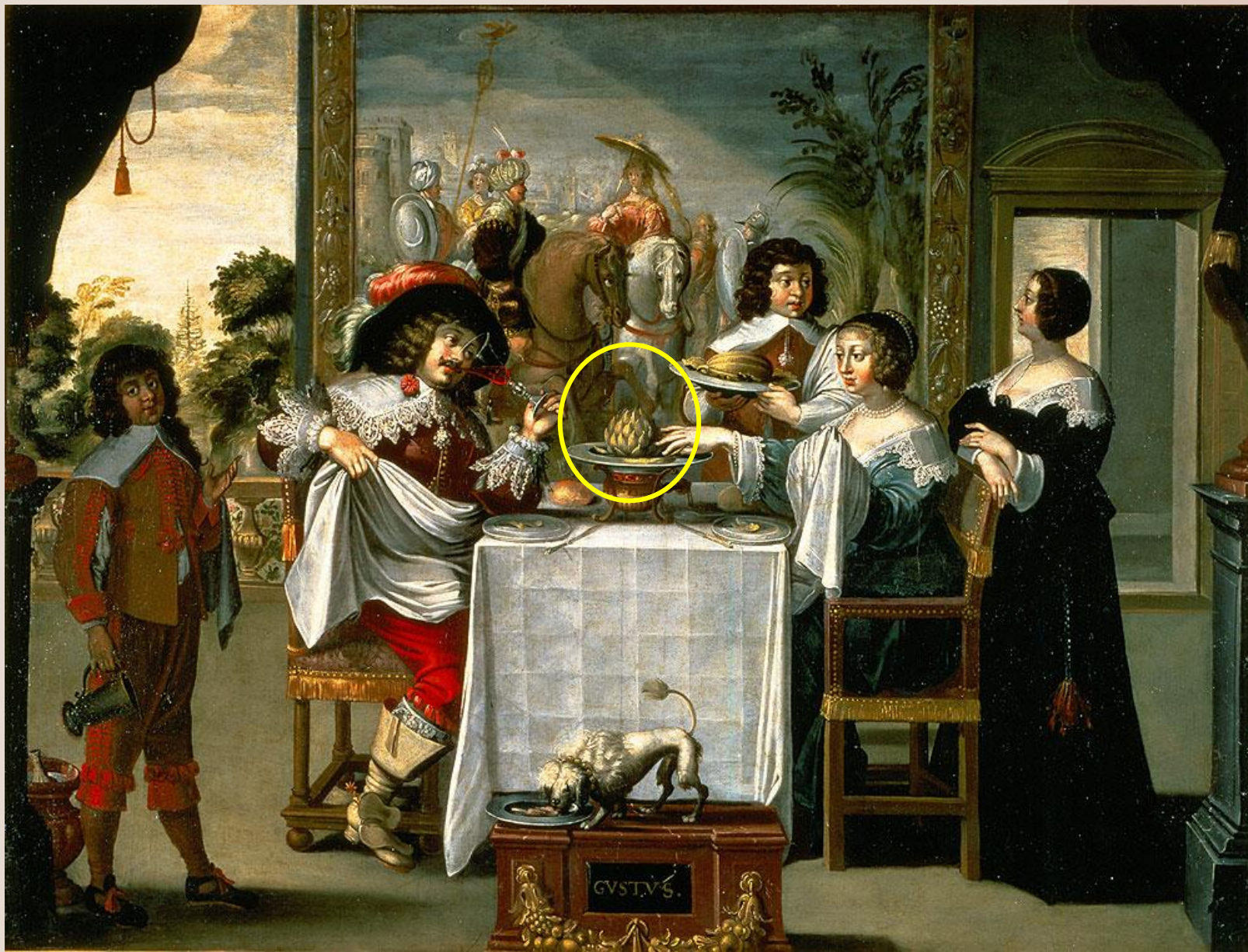
BOSSE Abraham (d'après), Les Cinq Sens 1638, huile sur toile, 134cm x 157cm, Tours, Musée des Beaux-Arts (Inv. 1912-1-3).