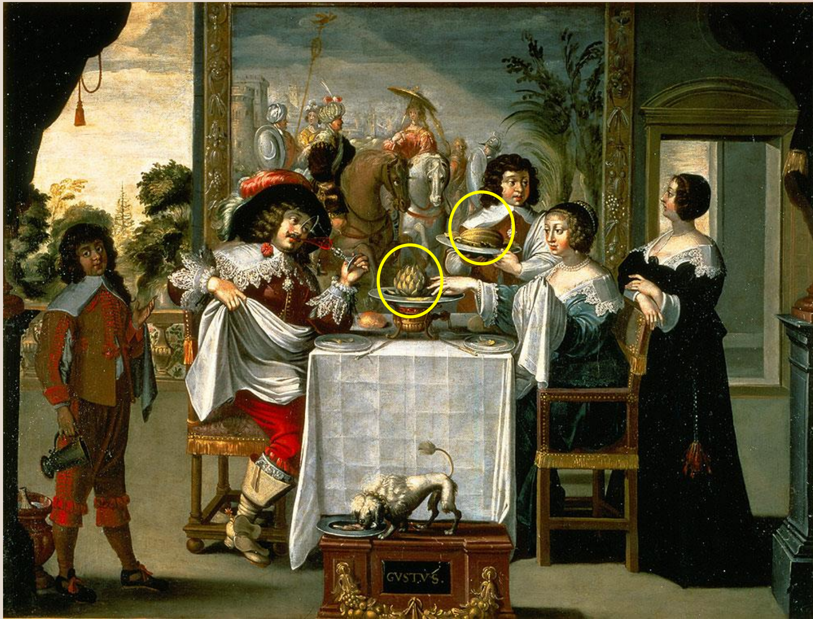
BOSSE Abraham (d'après), Les Cinq Sens 1638, huile sur toile, 134cm x 157cm, Tours, Musée des Beaux-Arts (Inv. 1912-1-3).