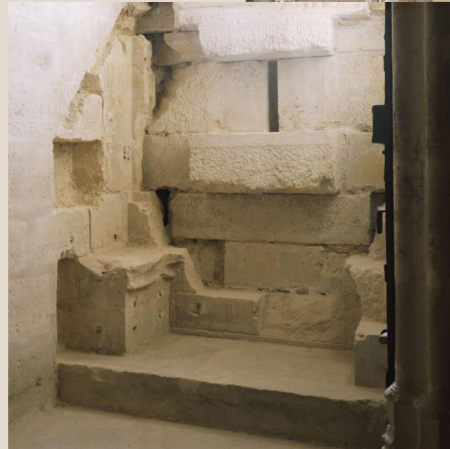
Château de Vincennes – Domus Dolorum