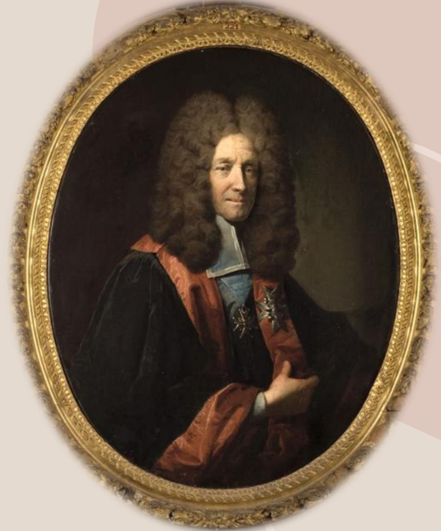
LE VRAC Robert (dit Tounières), Portrait de Louis de Pontchartrain, président du Parlement de Bretagne, XVIIe siècle, huile sur toile, 93 cm x 74 cm, Rennes, Musée des Beaux-Arts (D1963-2-1)