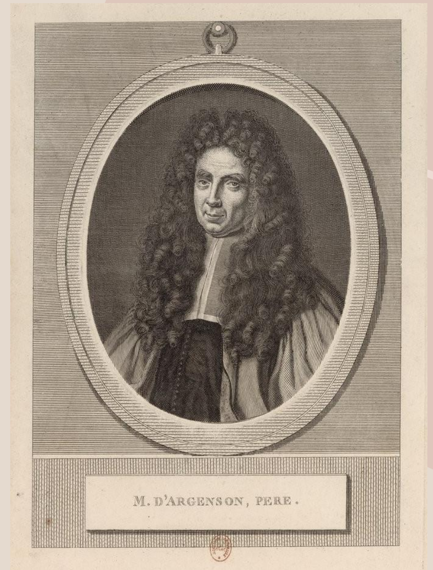
Anonyme, Portrait de Marc-René Voyer de Paulmy, marquis d'Argenson (Père) , [s.d], estampe, Paris, BNF.