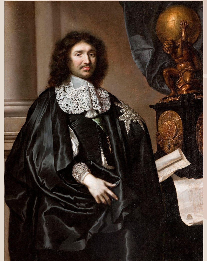
LEFEBVRE Claude, Jean-Baptiste Colbert (1619-1683), ministre , 1666, huile sur toile, H : 130cm ; L : 96cm, Versailles, Musée national du château de Versailles (MV 2185).