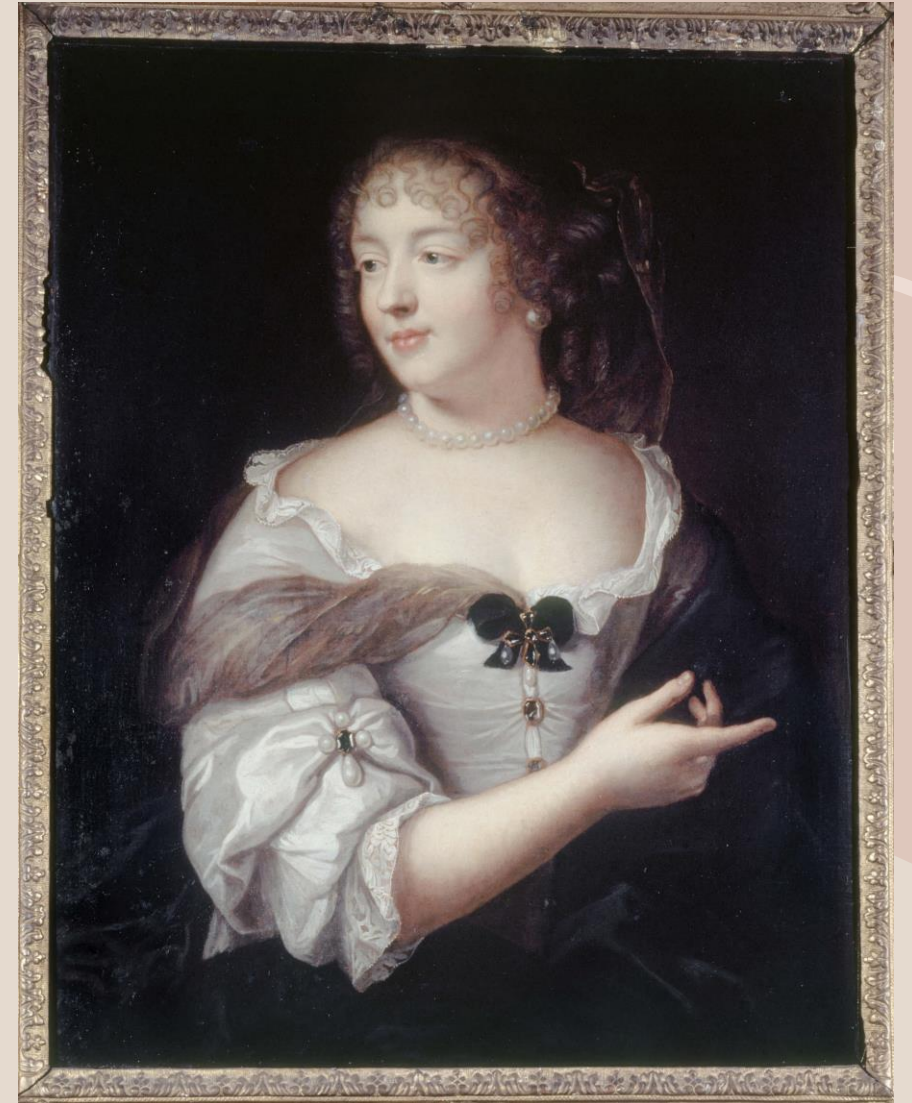
LEFEBVRE Claude (attribué à), Marie de Rabutin-Chantal, marquise de Sévigné , ca. 1665, huile sur toile, H : 103cm ; L : 87 cm, Paris, Musée Carnavalet (P1978)