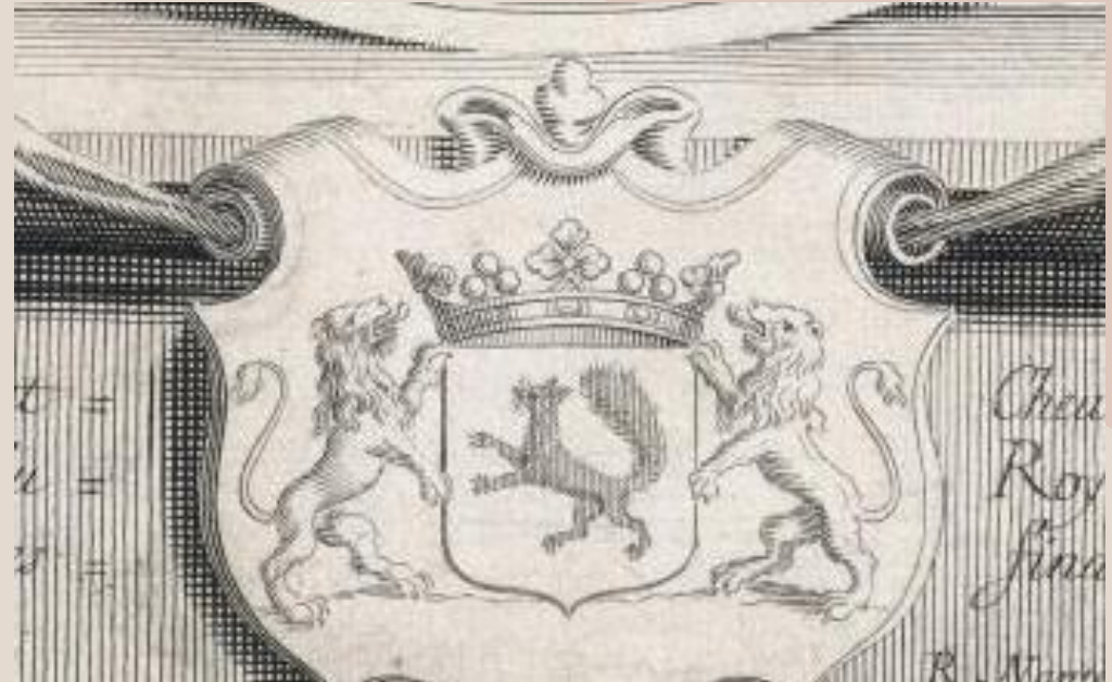
NANTEUIL Robert, Nicolas Fouquet , 1661, estampe, H : 32,6 cm ; L : 25, 2 cm, Paris, Musée Carnavalet (G.12)