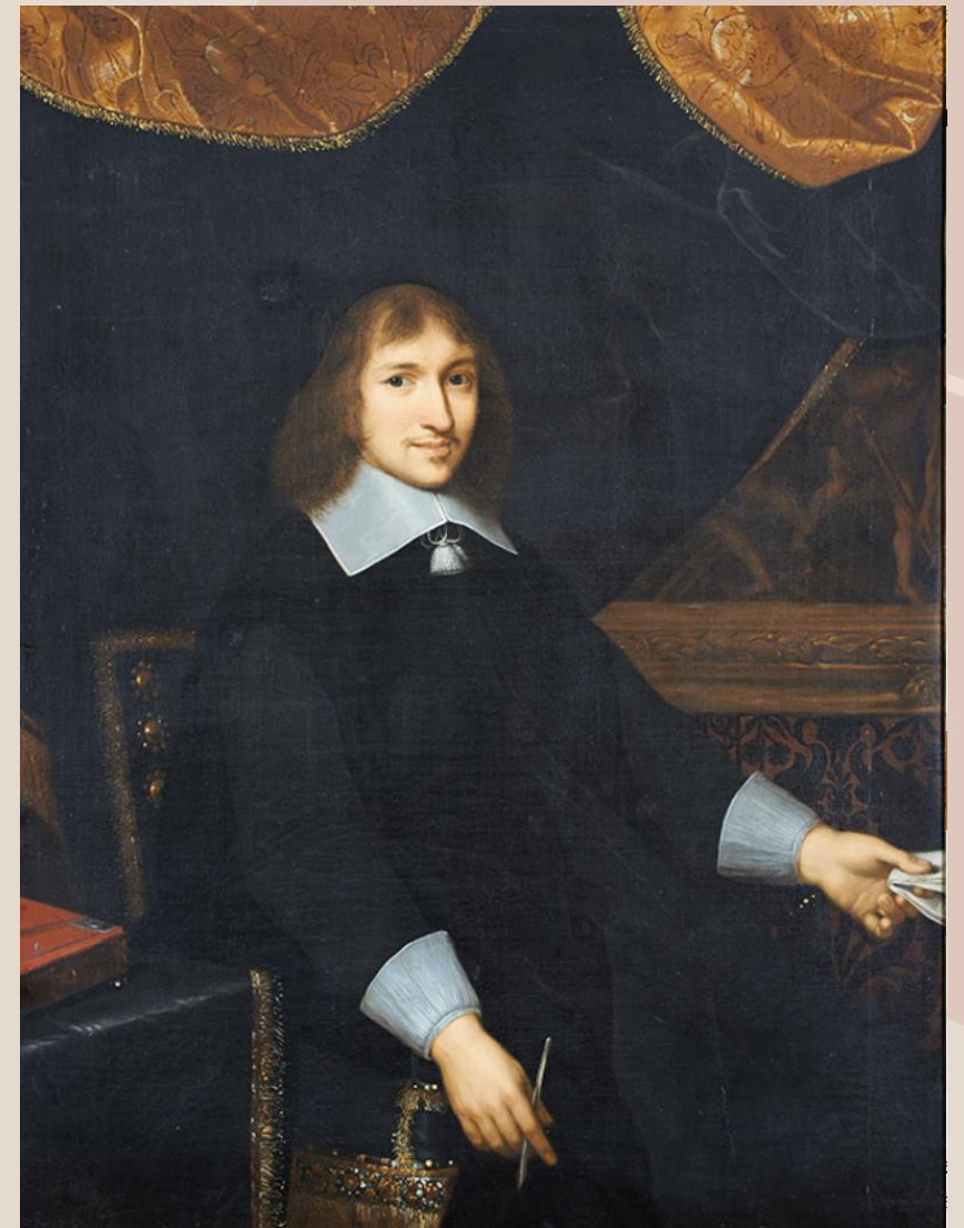
LEFEBVRE Claude (attribué à), Portrait de Nicolas Fouquet , ca. 1659, huile sur toile, H : 127 cm ; L : 96 cm, Maincy, Château de Vaux-le-Vicomte