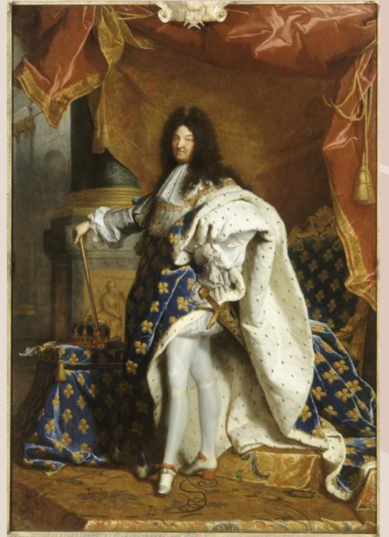
RIGAUD Hyacinthe, Louis XIV, roi de France , 1701, huile sur toile, H : 277 cm ; L : 194 cm, Paris, Musée du Louvre (INV 7492)